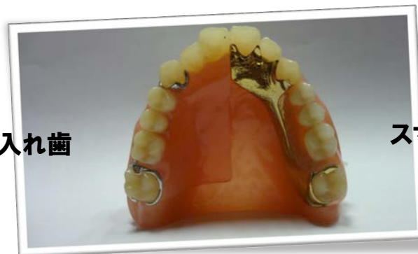
スマートデンチャー (金属床付)